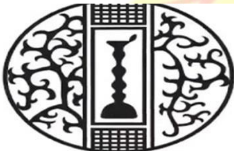
Indian Council for Cultural Relations भारतीय सांस्कृतिक सम्बंध परिषद्