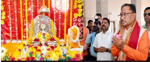
श्री रामलला दर्शन योजना छत्तीसगढ़